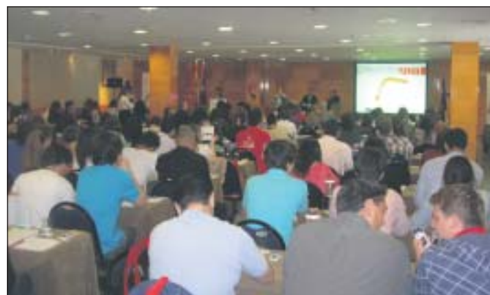
Congreuem 2011 reunió a más de un centenar de profesionales del turismo.

en Gestión y del Turismo de Congresos de la Universidad Europea de Madrid que pone de manifiesto su capacitación para organizar eventos de esta envergadura. En esta edición, el importe de la inscripción de los asistentes se destinó a Médicos Sin Fronteras, un Organización No Gubernamental médico-humanitaria internacional cuya labor se despliega alrededor del mundo ayudando a víctimas de catástrofes o conflictos armados.