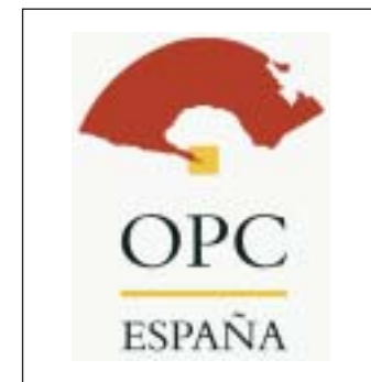
La Federación apuesta por la RSC.

Con la puesta en marcha de estos proyectos, la Federación Española de Organizadores Profesionales de Congresos desea invitar a otros agentes del sector turístico de reuniones a sumar esfuerzos y recursos al objeto de que se avance en competitividad y diferenciación por esta vía frente a otros destinos competidores.