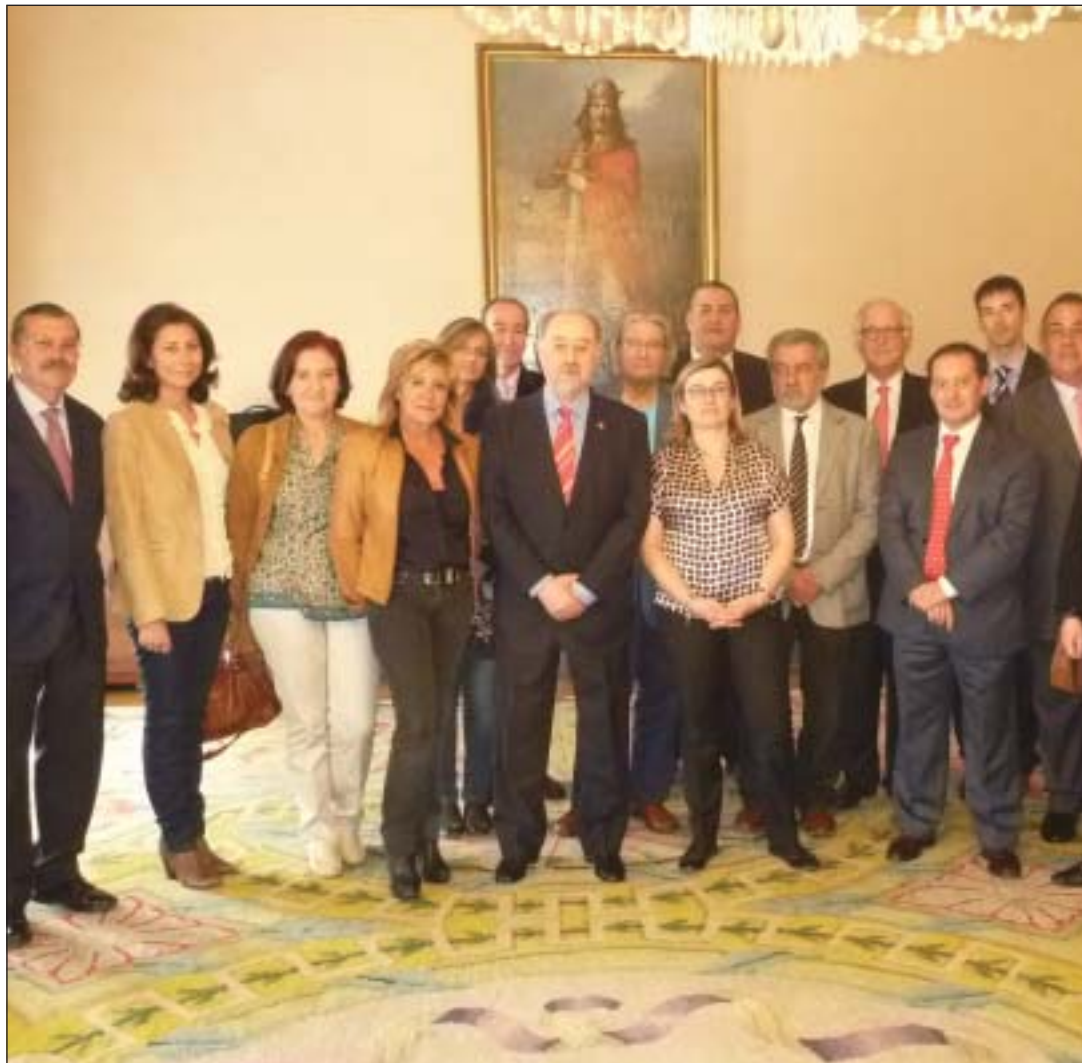
La Junta Directiva de OPC España junto con el alcalde de Oviedo, Gabino Lorenzo, se reunieron en la capital asturiana.