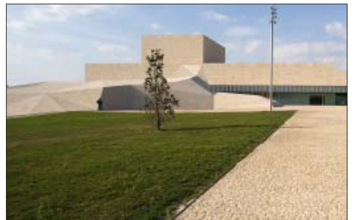
Imagen del Palacio de Congresos Lienzo Norte de Ávila.

Ávila, ciudad milenaria, situada en la Comunidad de Castilla y León, es atractiva y acogedora con sus visitantes y fue declarada Patrimonio de la Humanidad en 1985. El paseo por su recinto amurallado y por sus calles ofrece al visitante el reflejo de la historia en su arquitectura y sus gentes.