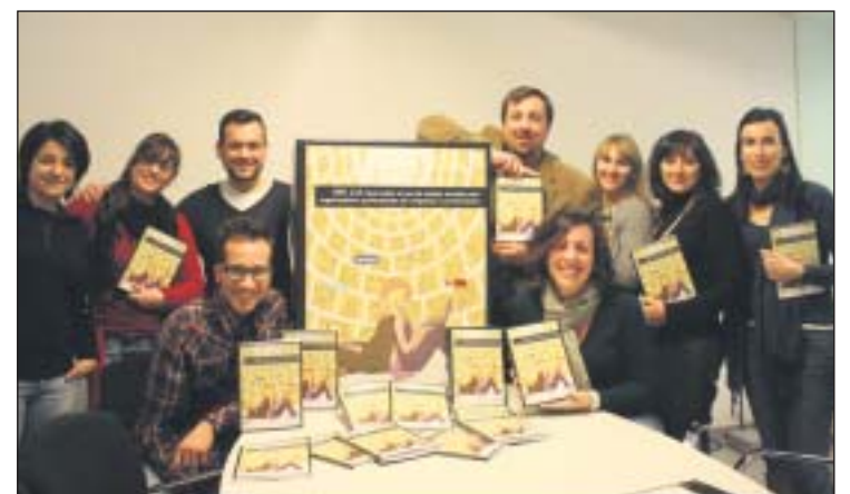
El equipo de Tarsa OPC con el libro sobre las redes sociales en el sector de los eventos.

A día de hoy la posibilidad de adquirir esta obra práctica y didáctica es ya una realidad. Se pueden comprar ejemplares a través de la web www.tarsacom.com/opc/ . También se ofrece la posibilidad de descargarse la obra en formato PDF.