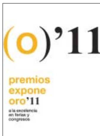
Logotipo de los Premios Expone Oro 2011.

La manifiesta importancia de las ferias y congresos como motores de la economía a nivel nacional e internacional, ha propiciado que El Economista, diario líder en noticias de economía, bolsa y finanzas, participe en esta iniciativa como media partner.