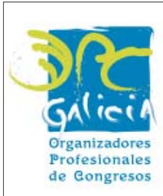
El logotipo de OPC Galicia.

De esta manera, OPC Galicia mantendrá informados de los últimos acontecimientos.