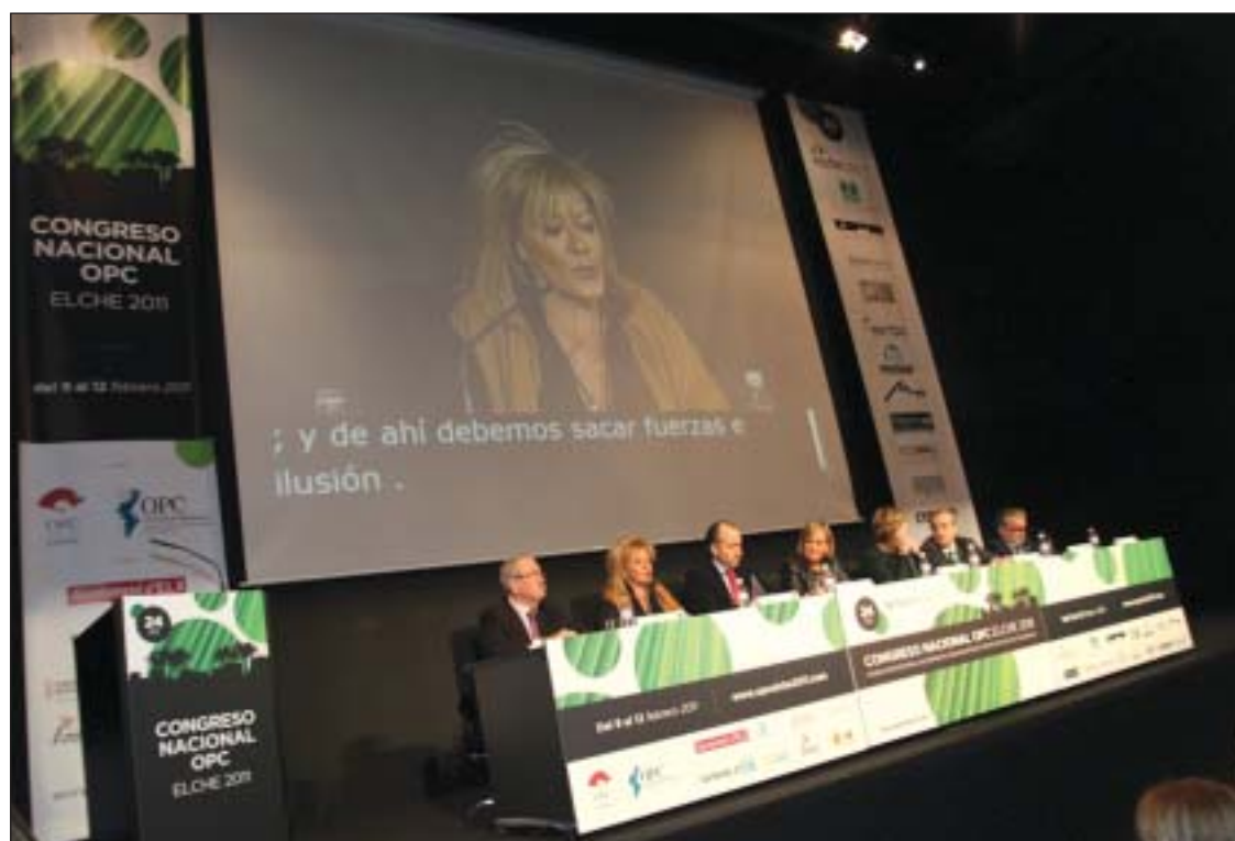
La presidenta de OPC España, Ascensión Durán, durante su participación en el Congreso Anual de la Federación en Elche.

Actualmente, la Federación está integrada por más de 300 empresas, lo que hace que OPC España sea la organización empresarial más representativa del sector turístico congresual en España. "Las asociaciones fomentan y mantienen las relaciones entre las empresas favoreciendo el intercambio comercial y la transferencia de conocimiento. Además, las asociaciones se constituyen en interlocutoras ante las instancias públicas y privadas para la defensa de los intereses del sector, a nivel autonómico, nacional e internacional, prestando servicios de calidad por parte de las empresas y promoviendo la formación, investigación y desarrollo de temas profesionales y empresariales", ha concluido Ascensión Durán.